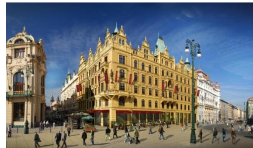
Světelná technika Hotel Republika | Praha