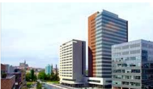
Rozvaděčová technika Spielberk tower | Brno