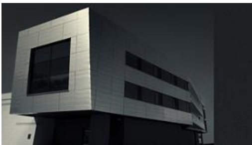
Rozvaděčová technika, měření a regulace HiLASE Dolní Břežany Mezinárodní laserové centrum