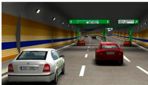
Rozvaděčová technika Tunelový komplex Blanka | Praha