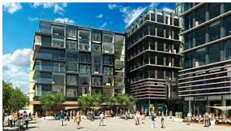
Rozvaděčová technika, strukturovaná kabeláž QUADRIO Centrum | Praha