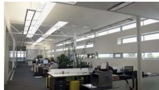
Rozvaděčová technika, kabeláž, IT TV Nova | Praha