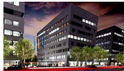
Rozvaděčová technika Prosek Point | Praha