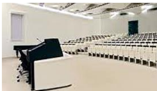
Světelná technika Ústav molekulární genetiky | Praha