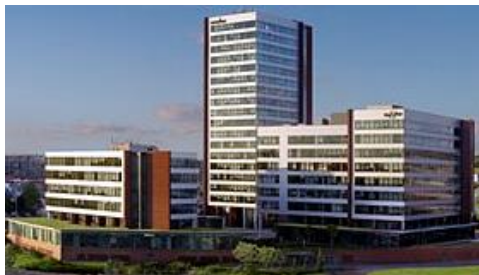
Světelná technika Office park Nové Butovice | Nové Butovice