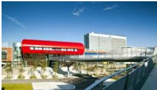
Rozvaděčová technika Univerzitní kampus Bohunice | Praha