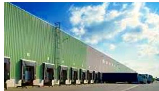
UPS záložní zdroje, kabeláž Logistické centrum Schenker | Praha