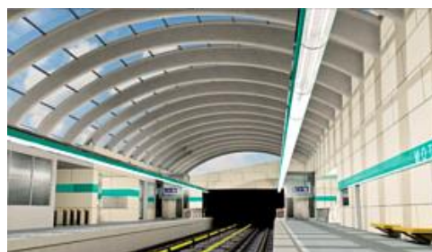
Rozvaděčová technika Výstavba trasy metra | Praha